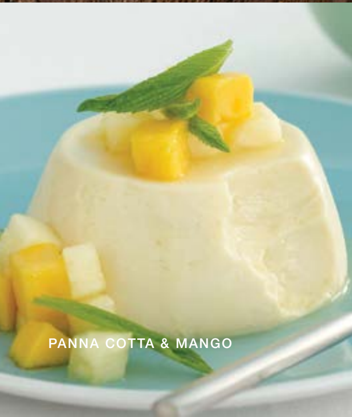
PANNA COTTA & MANGO