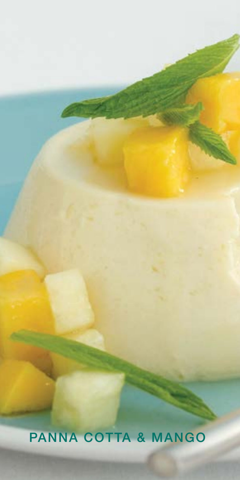
PANNA COTTA & MANGO

DAMA BIANCA 6 Vanille-ijs met chocoladesaus en slagroom.